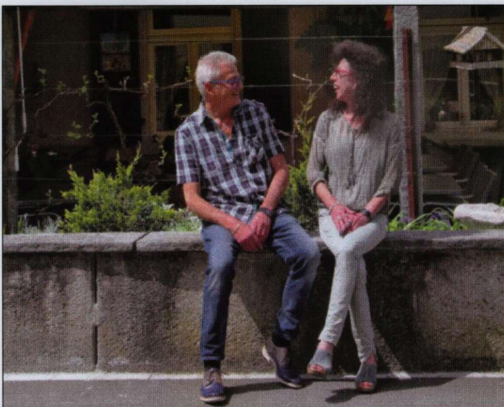
Immer gut drauf – die Gastgeber im Wybergli.