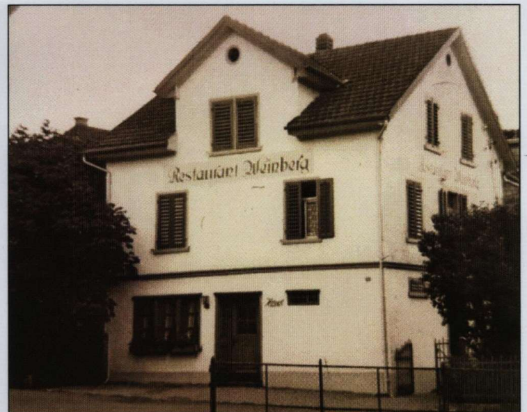
«S' Wybergli anno dazumal, ca. 1940».